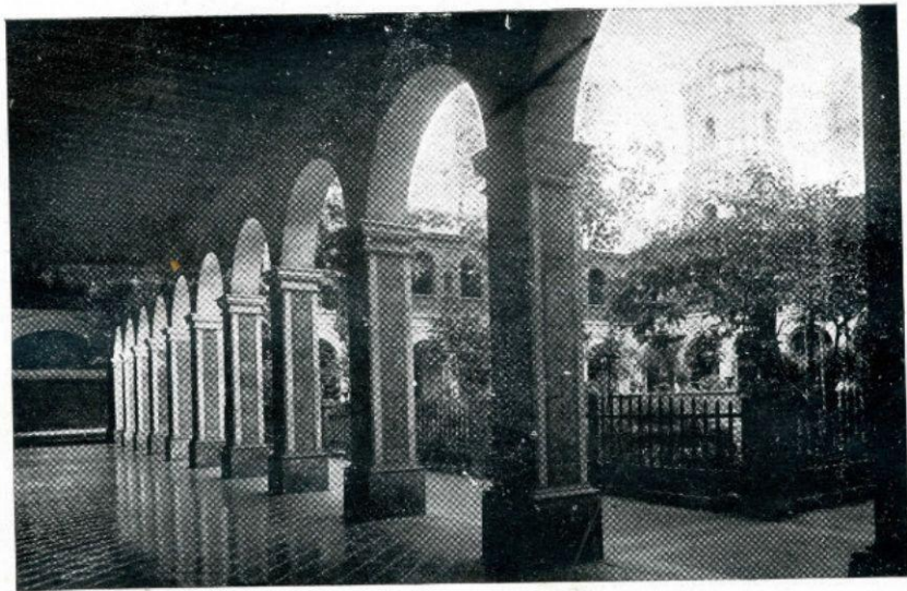
Uno de los claustros del Convento del Rosario donde nació la Universidad.