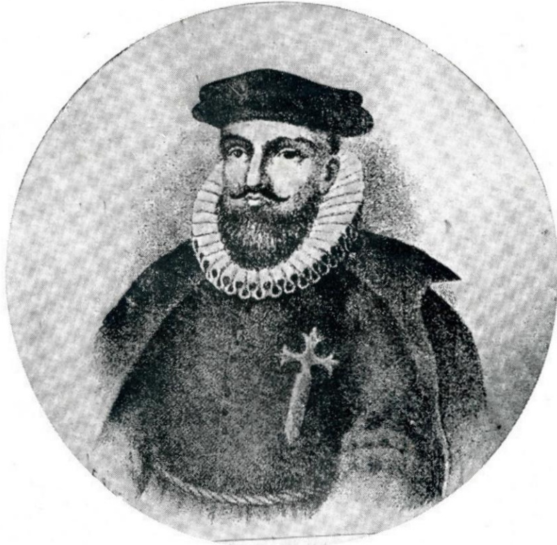
El Gobernador Licenciado Lope García de Castro, quien expropió diversas casas y solares para la construcción del Colegio de San Pablo.