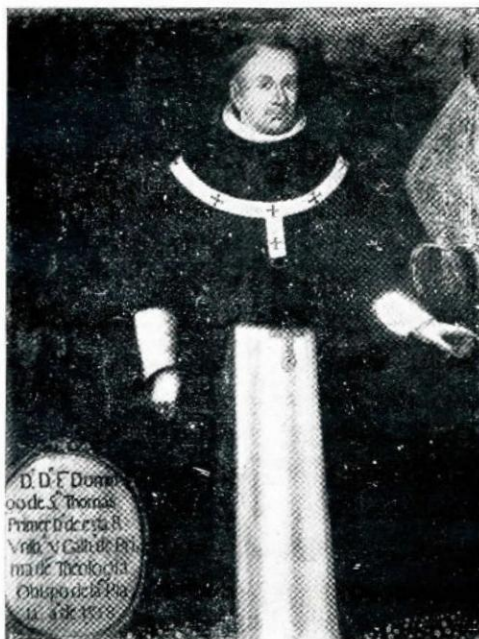
Fray Domingo de Santo Tomás, primer Catedrático de Teología. (Oleo antiguo de la Universidad).