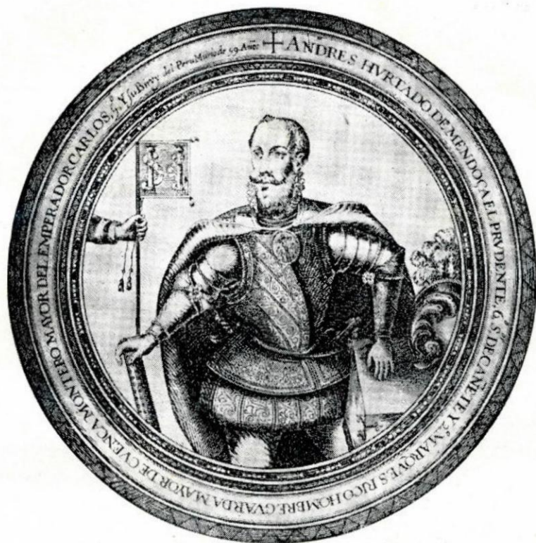
Don Andrés Hurtado de Mendoza, Marqués de Cañete, fué el primer Virrey que subvencionó a la Universidad.